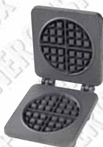
American-Style Typ 501