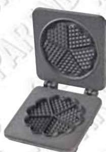
Herz-Form Typ 511