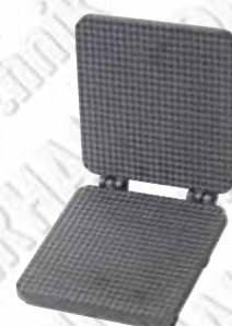
Eiswaffel-Form Typ 531