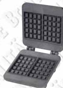
Brüsseler-Form Typ 521