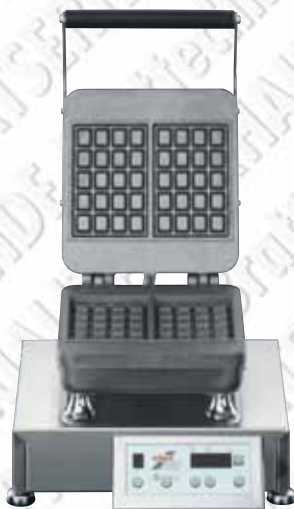
GTTPowerSave® Back-Duo Abbildung mit Backplatte 511 + 531