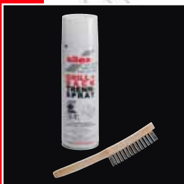
Bürste zum Reinigen + Trennspray inklusive