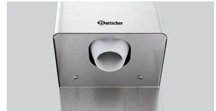
► Direktes Auffangen mit dem Glas möglich