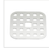
Quadratisches Tropfgitter 11,2 x 11,2 cm in Edelstahl