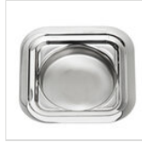
Quadratische Tropfschale 13,7 x 13,7 cm in Edelstahl